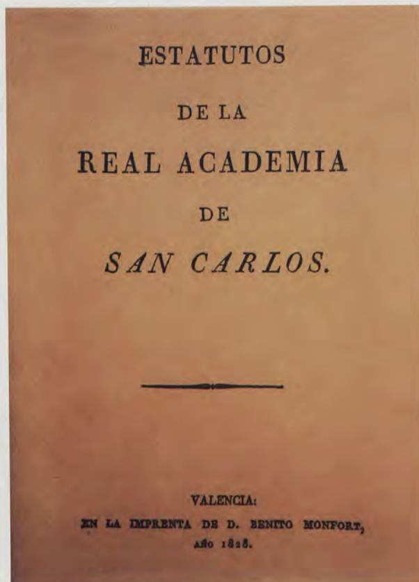
Estatutos de la Real Academia de San Carlos. Valencia, 1828.